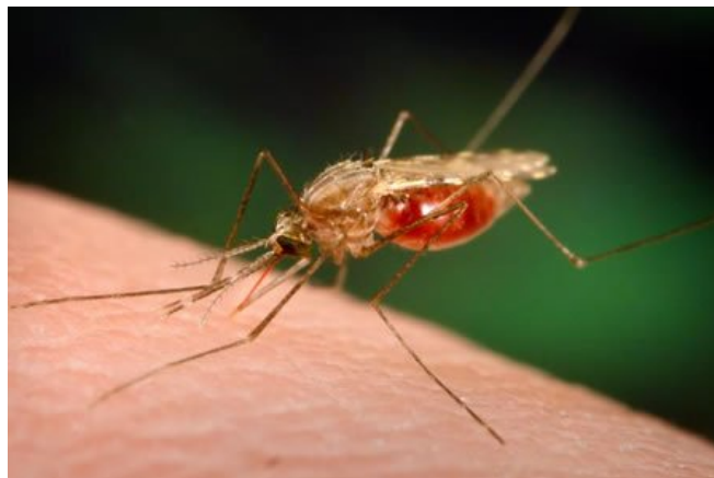
Malariamücke in typischer Haltung bei der Blutmahlzeit

An vorderster Stelle stehen deshalb heute Maßnahmen die verhindern sollen, daß eine infizierte Mücke und andere Überträger von Infektionskrankheiten zum Stich oder Biß kommen und damit Erreger übertragen. In Kombination und richtig angewandt reduzieren diese im folgenden aufgeführten Maßnahmen die Übertragungswahrscheinlichkeit um über 90%! Malaria übertragende Mücken (graubraune Anopheles Moskitos) stechen bis auf ganz wenige Ausnahmen nur zwischen Sonnenuntergang und Sonnenaufgang. 90% der Malariainfektionen werden zwischen 22:00 Uhr und 02:00 Uhr übertragen. In dieser Zeit ist deshalb erhöhte Vorsicht angebracht und z.B. der Aufenthalt im Freien auf das notwendige Minimum zu beschränken. Häufig ist auch die Wirkung eines eventuell benutzten Repellents schon abgeklungen. Dies macht die Wichtigkeit der Benutzung von Moskitonetzen deutlich.